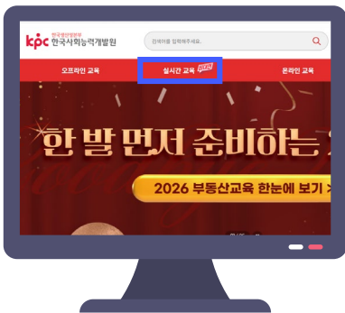
홈페이지 상단 [실시간 교육(비대면)]