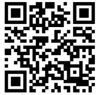
[PAYCO 어플설치 바로가기]