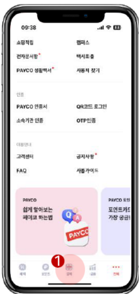
하단 중앙 [결제] 클릭