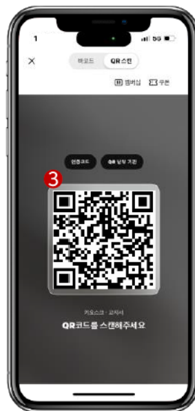
식당내 QR 스캔/바코드 스캔